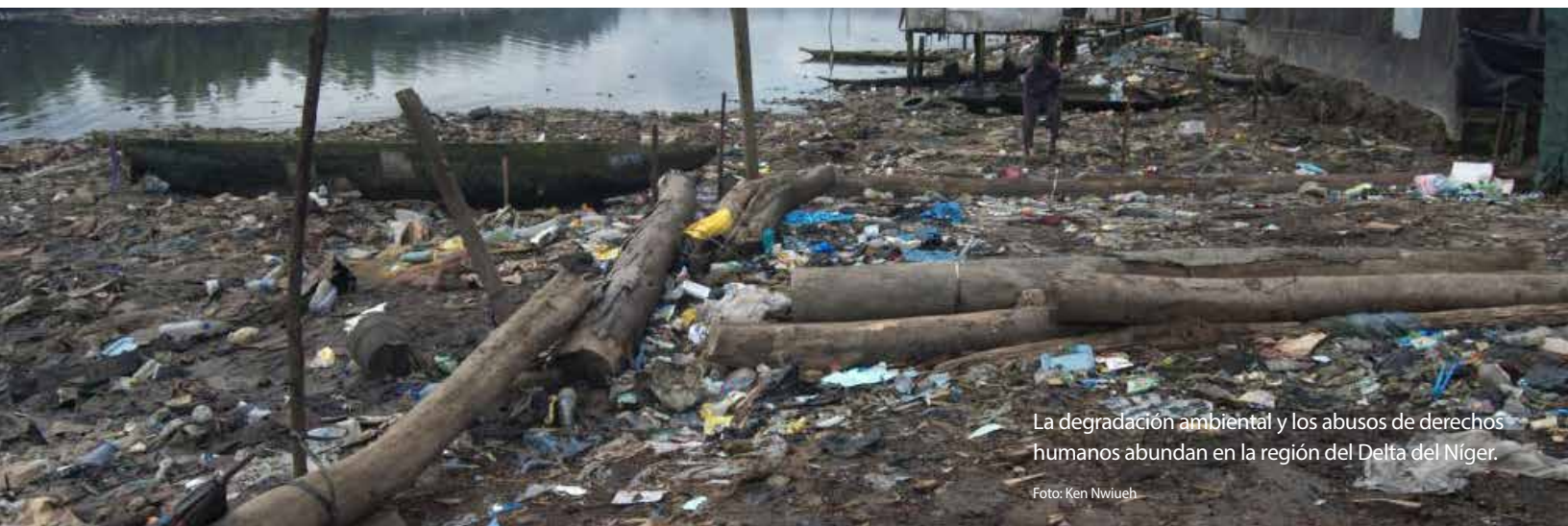
La degradación ambiental y los abusos de derechos humanos abundan en la región del Delta del Níger.

La campaña para conseguir un centro de servicios médicos en Oyigbo, además de los de Ahoada e Ikwerre, fue uno de esos tres esfuerzos emprendidos por la WITSOJ en 2011 para lograr mejoras en las instalaciones médicas. Responsabilizar a los gobiernos locales por el cumplimiento de la política sanitaria del Estado de Rivers fue el primer paso que dio el grupo en el logro de una movilización ciudadana que fuese más allá de la educación ciudadana y llegara a producir logros concretos.